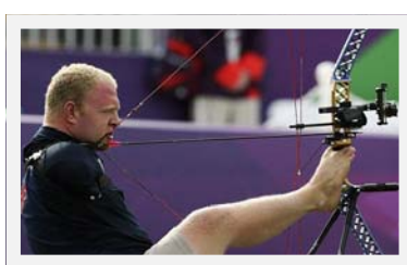
TIRO CON ARCO