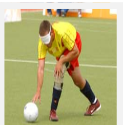
FÚTBOL 5 PARA CIEGOS